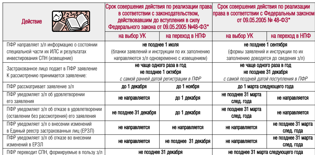
Сравнительная таблица по срокам реализации застрахованными лицами прав при формировании накопительной части трудовой пенсии

части трудовой пенсии, застрахованные лица смогут получить, обратившись в любой территориальный орган ПФР или в организацию, заключившую с ПФР соглашение о взаимном удостоверении подписей.